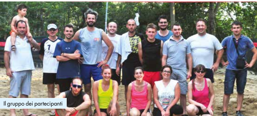
Il gruppo dei partecipanti

Domenica 19 luglio la boccifila Forti Sani di Fossano ha ospitato una 10 ore di beach volley. Alla manifestazione hanno partecipato 16 pallavolisti. Dopo sette turni di gioco gli organizzatori